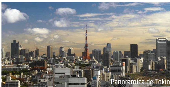
Panorámica de Tokio

Presentación en el aeropuerto 3 horas antes de la hora de salida del vuelo, para realizar los trámites de facturación. Salida en vuelo de Emirates con escala en Dubái destino Tokio (Japón). Salida de Madrid 15:20 hrs., salida de Barcelona 15:30 hrs. Noche a bordo.